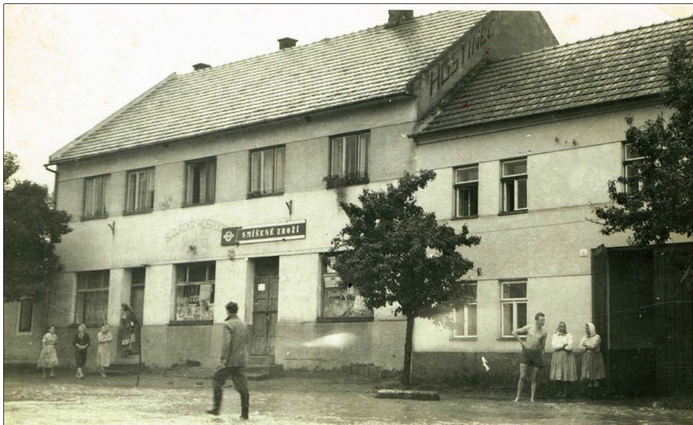
Rozvodněný Vlčnovský potok, voda byla až v dědině. 14. 8. 1955

Op víkendů 14. a 15. září, kterému předcházely velmi deštivé dny, byly na území celé naší republiky očekávány povodně. Dnes už víme, že nejhůře v České republice dopadli lidé na severní Moravě. Celkem si tato událost, která postihla země od Rumunska po Polsko, vyžádala 24 životů.