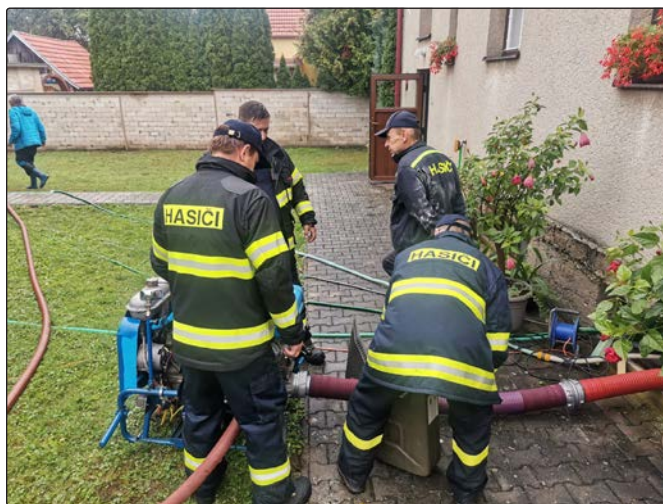
15. září 2024