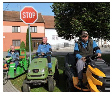
Obecní zaměstnanci připravení k úklidu před hodama