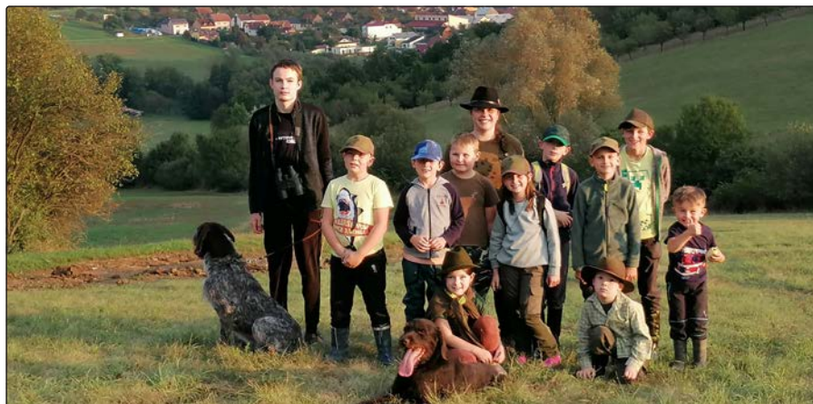
Myslivecký kroužek Kojetínek

Od minulého vydání zpravodaje se toho v našem spolku událo opět hodně. Některé věci byly radostné, jiné smutné. Život nám naděluje obojí a neustále nám tím připomíná, že si máme vážit běžných věcí a maličkostí a každý den děkovat za to, že tu můžeme být.