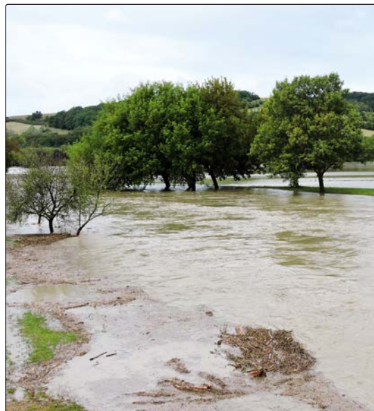
Olšava 15. září 2024