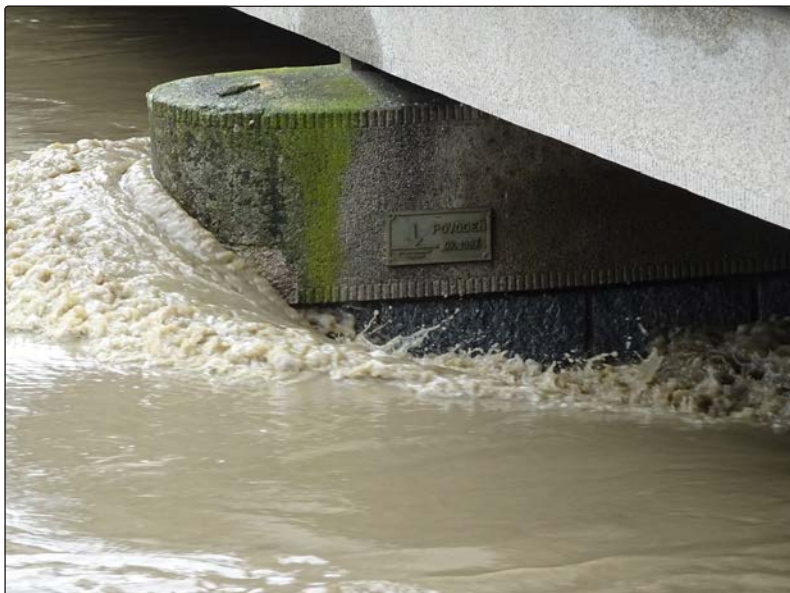
Hladina Olšavy při kulminaci 15. září 2024 (528 cm) a značka z roku 1997. Přesná data z měřicího bodu pod Olšavním mostem jsou k dispozici až od 3. června 2014.