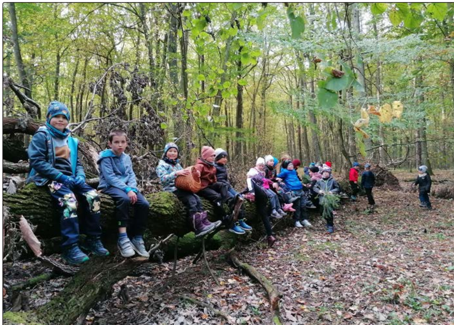
Návštěva ZŠ Vlčnov v Kojetínku

facebook: Myslivecký spolek Kojetínek, z.s.