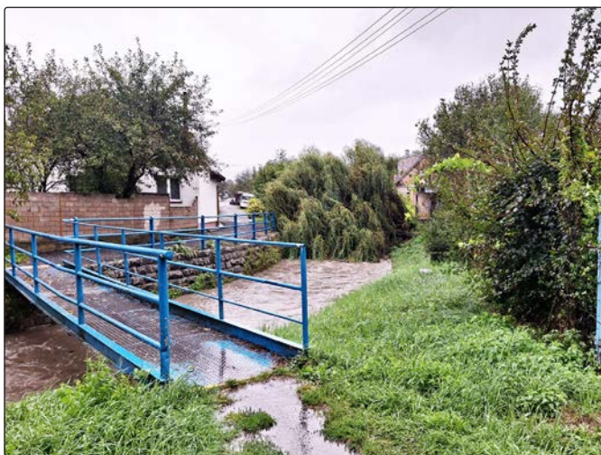
Vlčnovský potok 15. září 2024