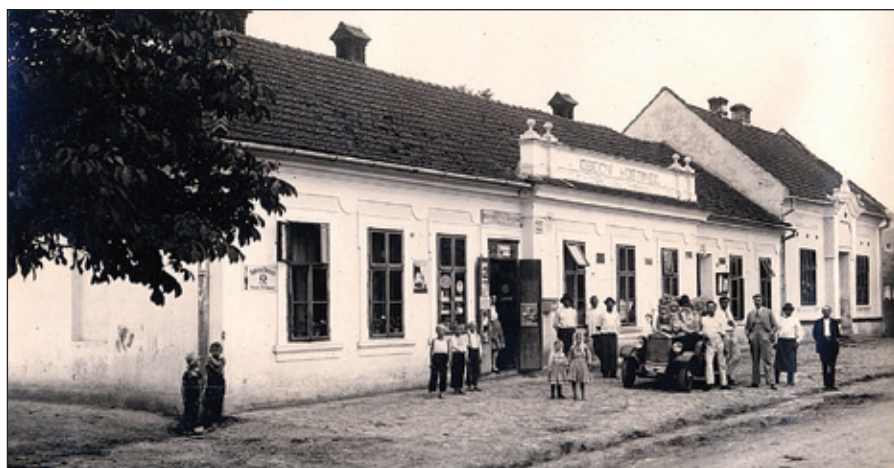
Dřívější podoba středu obce utvářel obecní hostinec s obchodem smíšeným zbožím a družstevní mlékárnou.