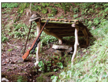
Opravená studánka v Kojetínku

Naše myslivecké sdružení Kojetínek Veletiny vzniklo 1. ledna 1993 odtržením od mysliveckého sdružení Míkovice. Hospodaříme na 600 ha honební plochy. Naší hlavní zvěř je především srnčí, dále pak zvěř drobná (bažant, zajíc). Tuto zvěř máme vedenou v kmenovém stavu a hospodaření s ní nám schvaluje náš nadřízený orgán z odboru životního prostředí v Uherském Brodě. V naší honitbě se vyskytuje také zvěř černá (divoká prasata), ale není vedena v kmenovém stavu, proto z této zvěře můžeme lovit pouze selata a lončáky.