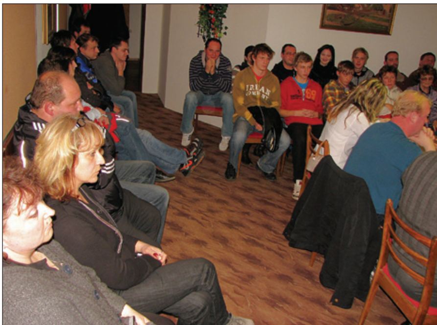
Na volbu starosty se přišlo podívat téměř 30 občanů.