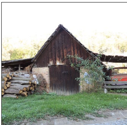
Bývalá Kolkova sušárna

Nejvíce se sušilo ovoce ze zahrad, to byly rozsáhlé sady, které už dnes neexistují. Jedny zahrady se táhly od Křivosúd kolem Olšavy až po hradčovský mlýn. Další zahrady – než se zregulovala Olšava – sahaly od Veletin až k železnici, i za železnici až po Podolsko. A těmito zahradami se klikatila Olšava. Ovoce bylo i ve vinohradech, ale ty zarodily málokdy, tam je sucho.