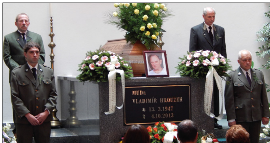
Rozloučení s naším členem

zvěř u nás hojně vyskytuje, nepodařilo se nám na společných honech divočáky ulovit.