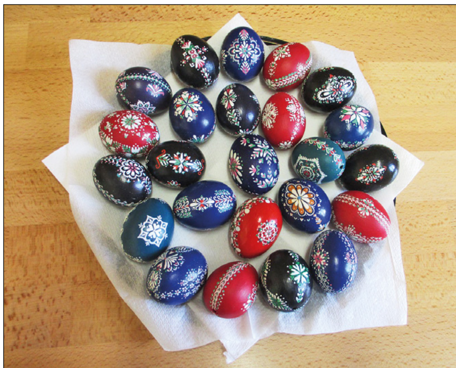
Kraslice, jeden ze symbolů nadcházejících Velikonoc, jak je maluje Michaela Vildová.