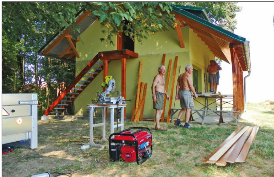
Práce na myslivecké chatě

Za tuto zimu jsme neměli štěstí při nahánkách na černou zvěř. Ačkoliv se tato