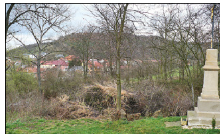
Současné využití žlebu: někteří se sem chodí pomodlit, jiní vysypat odpad.

Celkový rozpočet na terénní úpravy a ozelenění žlebu je projektantem vyčíslen na 1,6 mil. Kč, ale ten bude určitě výběrem nejvhodnějšího dodavatele snížen.