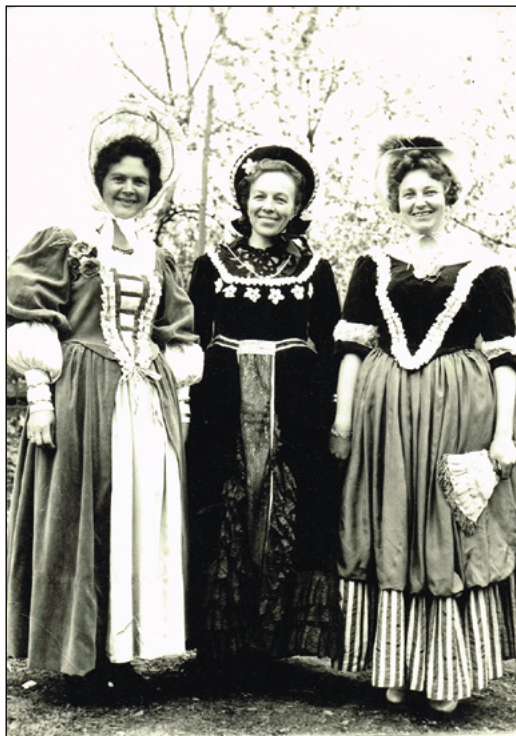
Ze hry Dámy a husaři , 1965 (převzato z kroniky ochotnických divadelníků ve Veletinách)

A těm, kteří pamatují na onu slávu ochotnického divadla ve Veletinách, věnuji tyto řádky. Těm, kteří stejně jako já vzpomínají na časy, kdy seděli v hledišti sálu ve Veletinách a čekali, až se otevře opona a začne se odvíjet příběh půvabné pohádky, kterou hrají jejich děti nebo vnuci, nebo to bude příběh o lásce, kterou budou společně s herci jim tak dobře známými společně