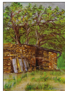
Velecké zákoutí na obrázku M. Vildové