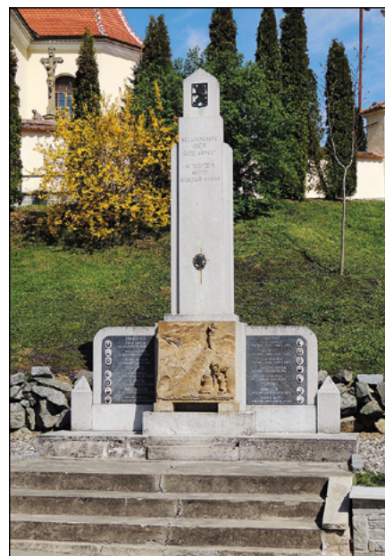
Památník obětem druhé světové války v Hradčovicích

Koncem října odešla ze zdejší obce německá policie a již se nevrátila. Neudala sice za celou dobu nikoho, ale občané si přece jen oddychli, poněvadž Němcům nebylo možno věřit. Za týden po jejich odchodu navštívili zdejší obec partyzáni a vzali