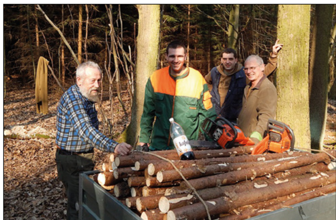
Brigáda – výroba kolíků ke stromkům