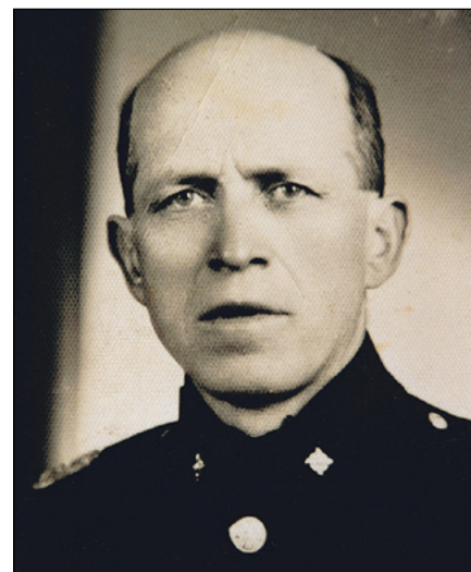
František Křivda, 1898–1945

dle potřeby používalo. Řídicí učitel zachraňoval co se dalo, ale vojsko odměňovalo jeho starost o školní majetek poznámkami, že aby život zachraňoval a ne papír a skleněné rourky. Válka má svůj líc a rub. Co se zachránit dalo, je zde a to ostatní je všech-