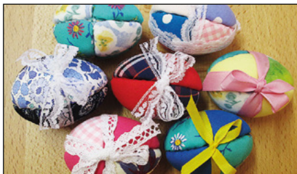
Jarní prázdniny v knihovně – patchworkové kraslice