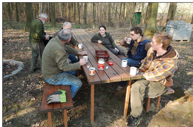
Odpočinek u chaty po brigádě

Minulý rok kromě práce v honitbě jsme také dokončovali nástavbu naší chaty. Pořádilo se nám dokončit podlahu, vymalovat a vybavit provizorním nábytkem. Ten bychom chtěli v tomto roce nahradit už kvalitnějším a lepším zařízením. Začínáme také dělat terénní úpravy kolem chaty, včetně položení nové dlažby namísto starého popraskaného betonu.