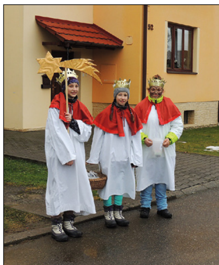
Při tradiční tříkrálové sbírce se v naší obci vybralo 17 035 Kč.