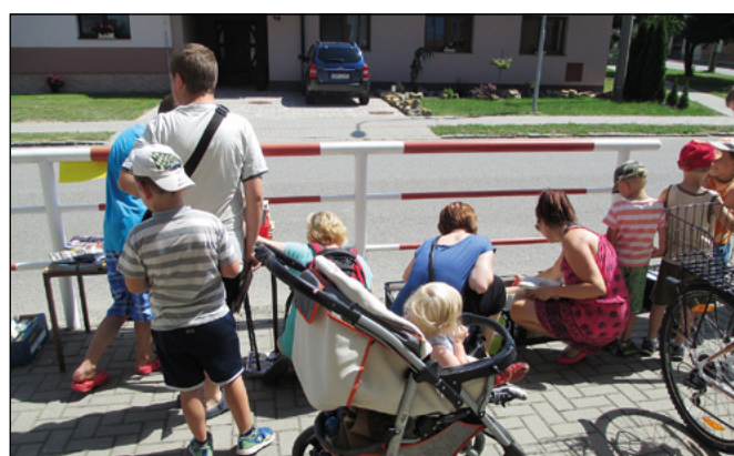
První prázdninový den uspořádala knihovna výprodej vyřazených knih a časopisů.