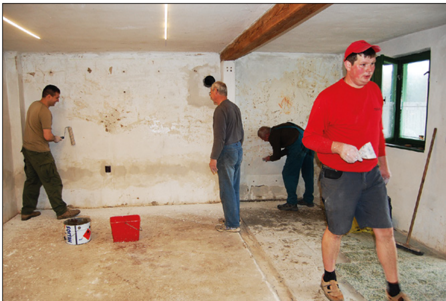
Brigáda na chatě

na které probíhá např. i přijímání mezi myslivce a pasování na lovce zvěře.