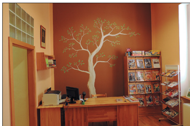
Nová výzdoba knihovny od Lucky Smejkalové.