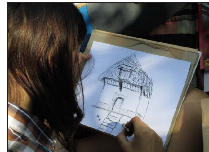
V rámci prázdninového týdne