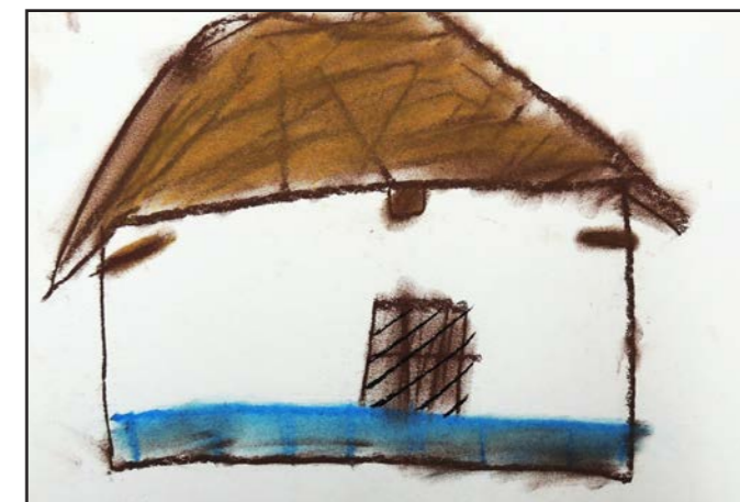
Tuto budo nakreslil Vojta Zemek.

Sledujte http://mistni-knihovna-veletiny.webnode.cz