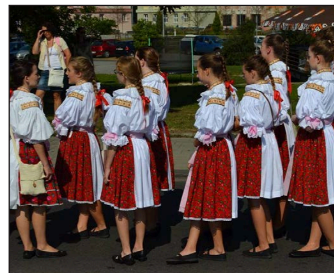
V nových krojích na Slavnostech vína