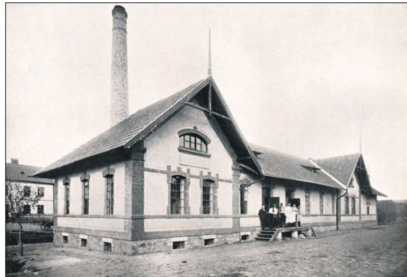
Rolnická parní mlékárna v Hradčovicích