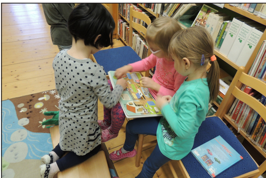
Děti z MŠ navštěvují knihovnu jednou měsíčně

Bližší informace o programu v knihovně najdete na našich webových stránkách. Je možné, že se něco změní, třeba i něco přibude. Proto buďte ve střehu.