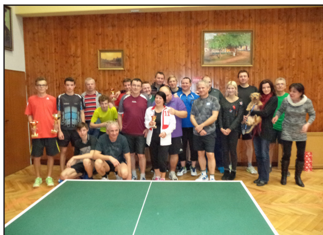
Z tradičního turnaje Veletiny Open 2016 o pohár starosty Veletin