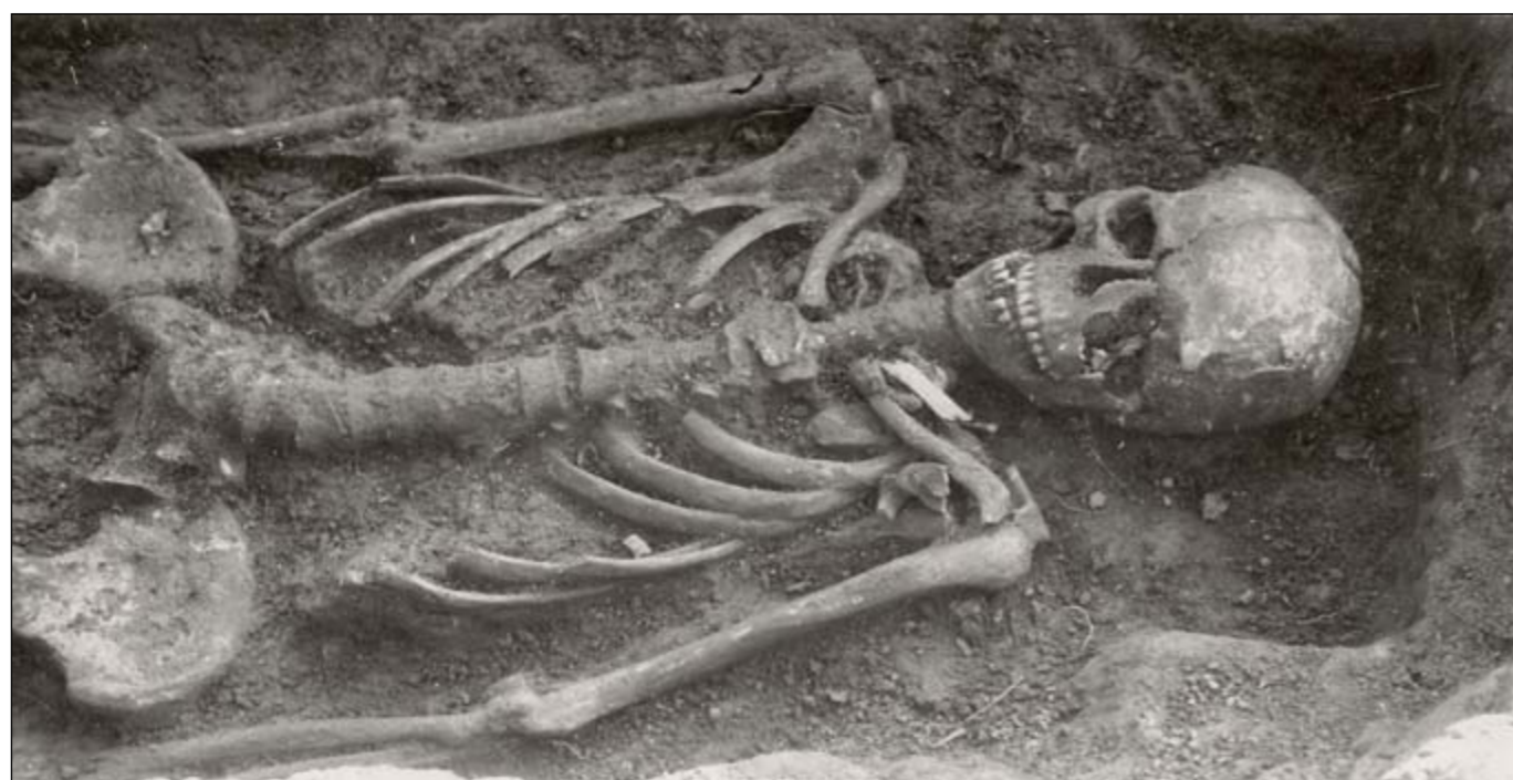
Žena 25 let, hrob č. 9

Galušku, CSc. z Moravského zemského muzea v Brně, specialistu na slovanskou archeologii, který mi poskytl literaturu a zajímavé informace k nálezům na pohřebišti ve Veletinách.