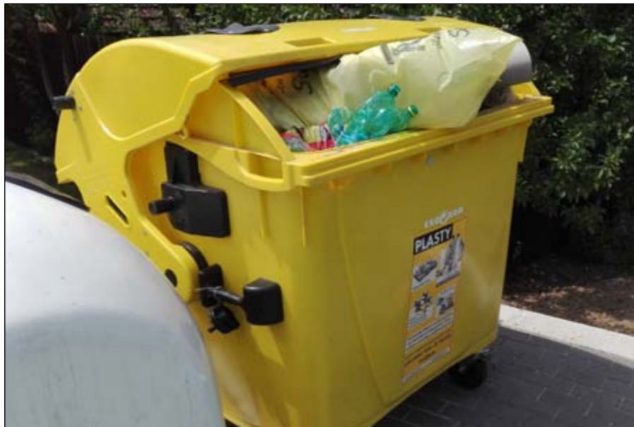
Pytle Rumpold nepatří do kontejneru. Poslední pátek v měsíci je svázejí zaměstnanci obce.

K vizáži obecního mobiliáře, který byl nainstalován na dětském hřišti u obecního úřadu a v parku na návsi u kapličky, si dovoluji poznamenat, že toto vybavení se stalo doslova terčem většinou kladných reakcí i ze strany návštěvníků z blízkého i vzdáleného okolí. Podotýkám, že např. modřínový plot oddělující parkoviště u pohostinství od dětského hřiště, případně nainstalované lavičky, nemají sloužit jako nějaká přelážka. Je potřeba také připomenout, že za bezpečnost na dětském hřišti stejně jako kdekoliv jinde odpovídají zákonní zástupci dětí.