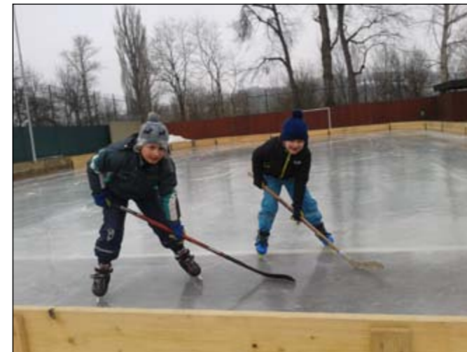
V zimě jsme si výjimečně užili ledu.