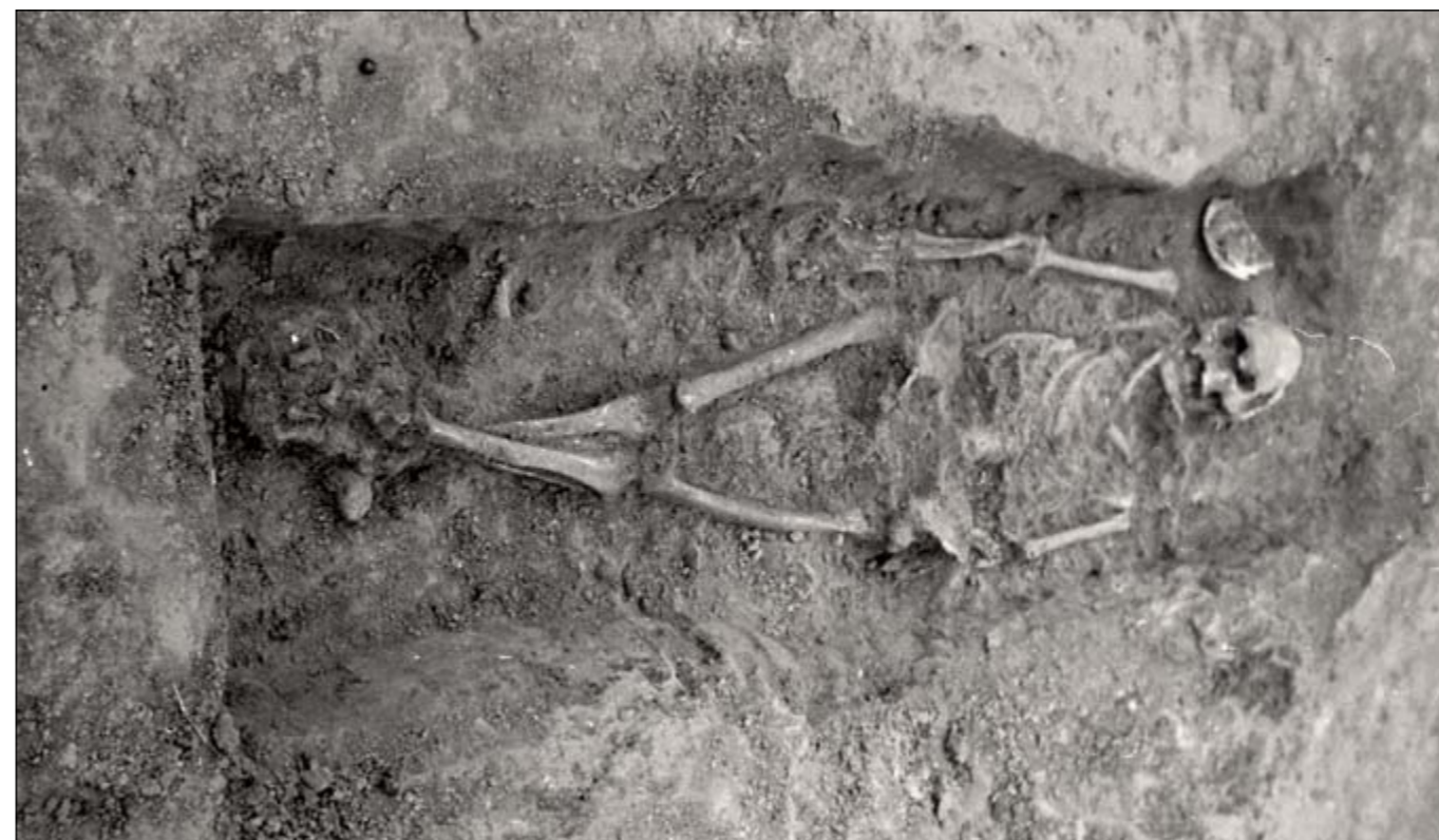
Žena 60 let, hrob č. 7