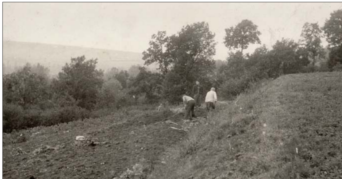
Pohřebiště, sonda 1, 1952