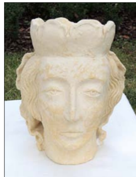
Svatá Ludmila od Michaely Vildové