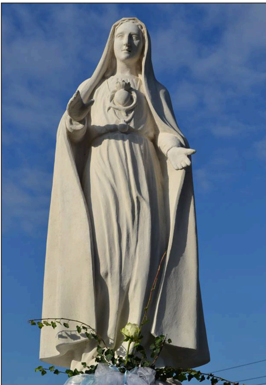
7. října 2017 byla slavnostně požehnána socha Panny Marie Fatimské