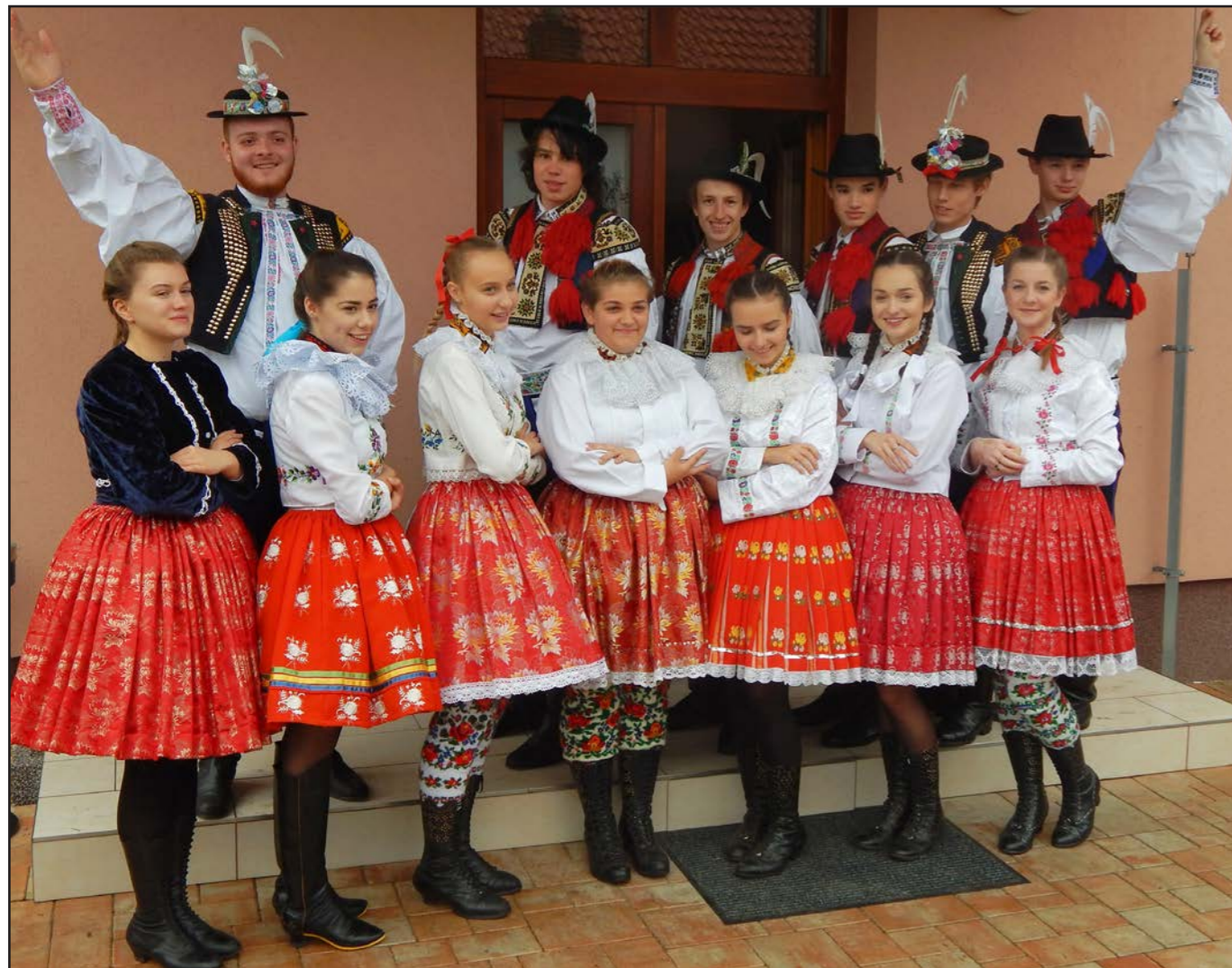
Kvůli dešti se tentokrát nekonalo nedělní vození barana, chasa i návštěvníci se veselili v sále kulturního domu.