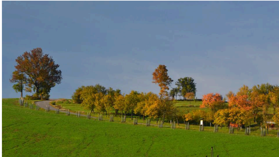
Pozemkové úpravy v Hradčovicích