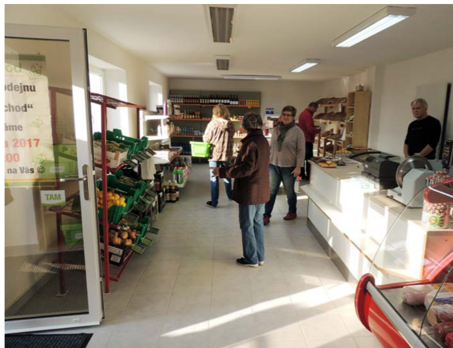
Slavnostní otevření prodejny smíšeného zboží 13. 10. 2017

Významného úspěchu dosáhla naše obec při nakládání s odpady. V rámci Zlínského kraje jsme byli v soutěži s názvem „O keramickou popelnici“ vyhodnoceni na krásném 5. místě ve třídění odpadů v obcích od 500 do 1500 obyvatel. Finanční efekt má tato soutěž vypsána firmami zabývajícími se odpadem až od místa třetího (bohužel). Každopádně touto cestou bych Vám všem chtěl velmi poděkovat za správné třídění odpadu. Má to opravdu