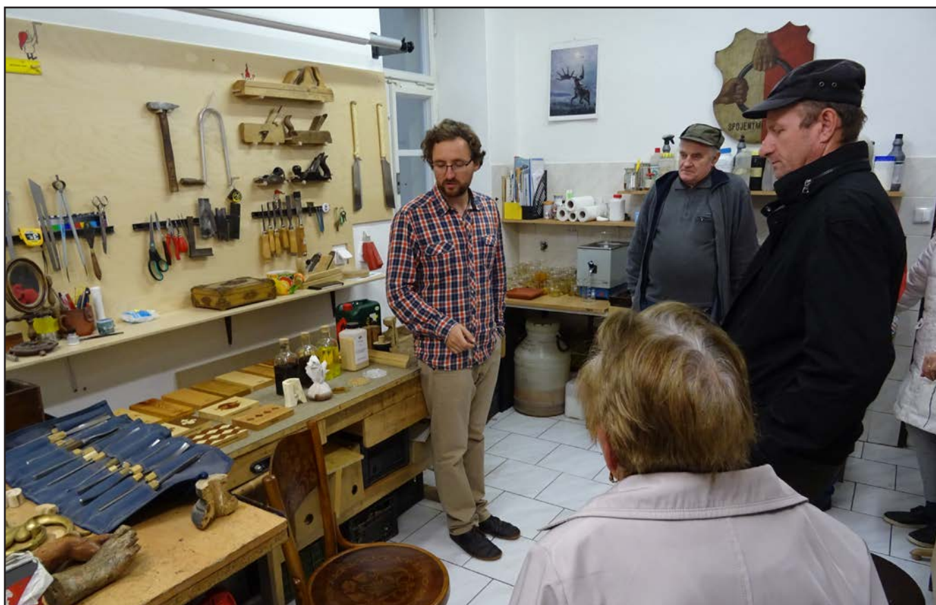
V restaurátorské dílně Slováckého muzea.