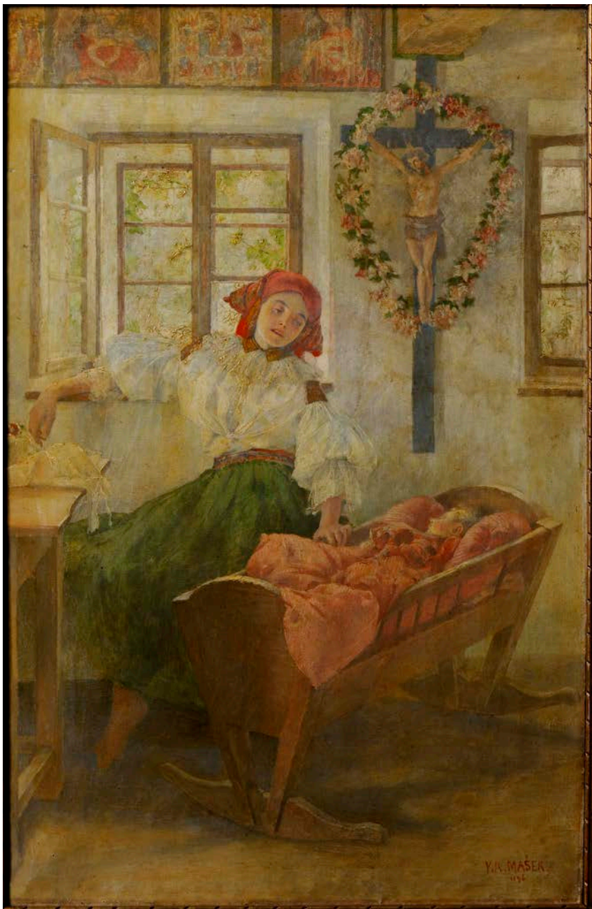
K. V. Mašek: Ukolébavka (1896), olej, plátno, 73 x 48 cm, Slovákcké muzeum v Uherském Hradišti

považována za klenot architektury. Podílel se na dostavbě katedrály sv. Víta v Praze, projektoval jeden z prvních návrhů pražské ZOO v Troji, věnoval se úpravě projektů na rozšíření Hodonína, Jaroměře a Luhačovic. U příležitosti asanace pražského Josefova začal navrhovat nové činžovní domy (Pařížská, Široká atd.). Mašek zemřel 24. července 1927 ve své vile v Praze ve věku 61 let.