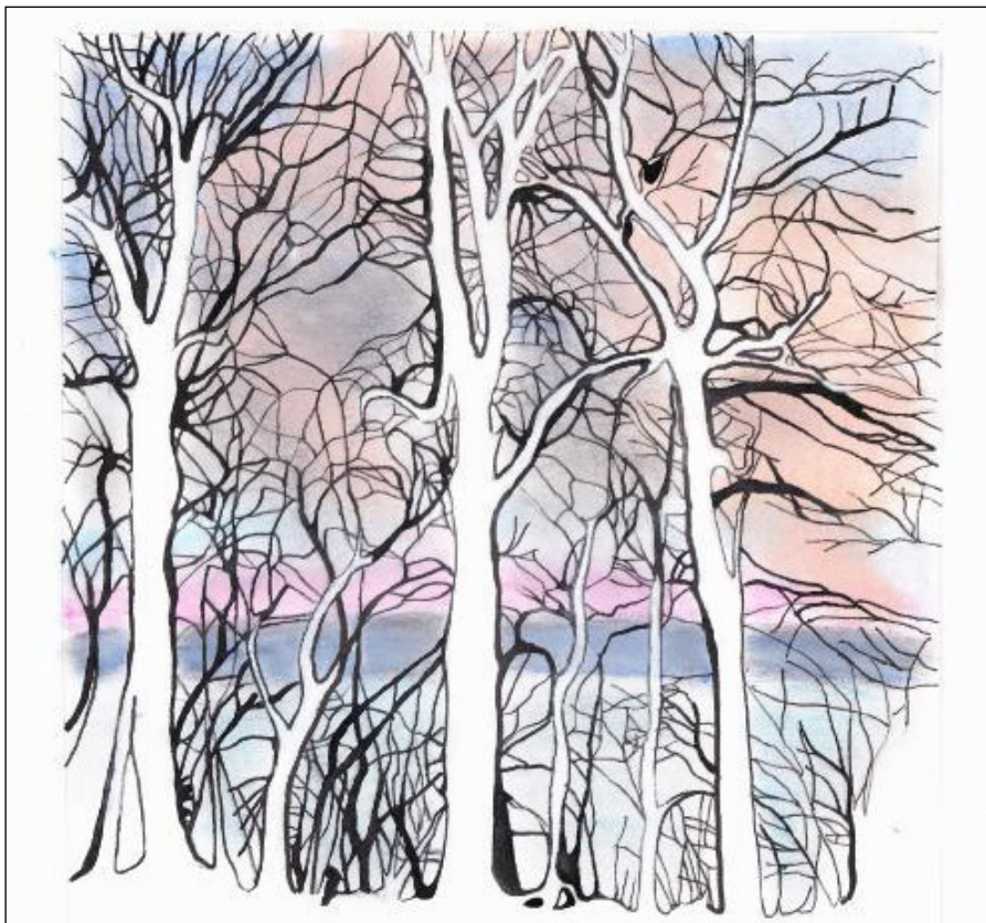
Michaela Vildová: Březový háj, akvarel