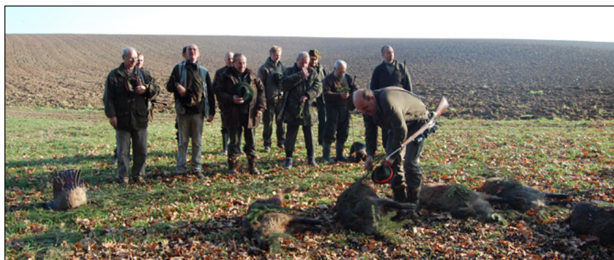
Úspěšný konec naháňky