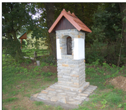
Boží muka ke cti sv. Huberta