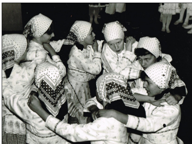
Veletánek v roce 1989

Po několikaleté pauze se soubor prezentoval také na Jízdě králů ve Vlčnově. Nechyběla ani tradiční vystoupení na Pytlácké noci, setkáních seniorů, Slavnostech vína a jiných akcích v okolí.