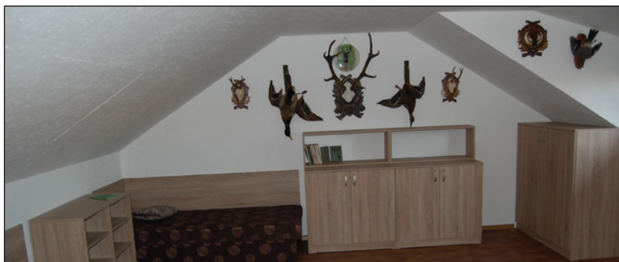
Interiér nástavby chaty